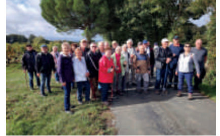
Sortie à Martigné-Briand

Il est proposé quelques rencontres à la journée avec pique-nique et un week-end de découverte de 3 jours.