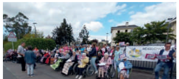
« Les vieux méritent mieux! » Manifestation du 24 septembre 2024