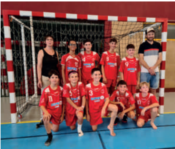
L'équipe des U14 masculins

En cette saison 2024/2025, nous accueillons 121 licenciés. Nos adhérents sont répartis dans les 10 équipes suivantes :