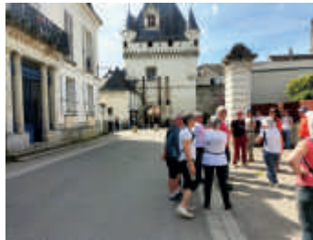
Sortie de 3 jours à Loches

Nous avons depuis l'origine du club une formule adaptée qui nous est chère, c'est : « Avec les godillots il fait toujours beau ! » Il faut avouer que depuis un an cela ne s'est pas toujours vérifié. Nous avons dû à maintes reprises changer le programme pour ne pas se retrouver les pieds dans l'eau.