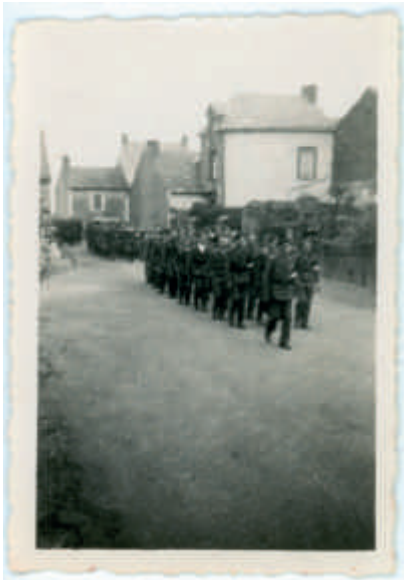
Départ rue de l'Écheveau des FFI de Riaillé le 11 août pour rejoindre le 1er Bataillon de Marche FFI de St-Mars-La-Jaille

Les maquisards apprennent la Libération de Riaillé et sortent de leurs caches. Les Américains réclament "Yacco" qu'ils conduisent à Pouancé au PC du Général Patton. Il faut regrouper à Riaillé les FFI dispersés.