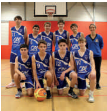
L'équipe U18 M