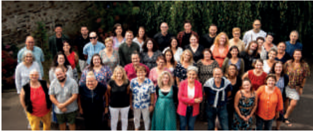
L'équipe de l'ensemble scolaire de Riaillé (collège Saint-Augustin et école Notre Dame)

Le collège travaille en réseau avec les écoles primaires privées proches et tout particulièrement avec l'école Notre-Dame de Riaillé, mais aussi avec les lycées proches.