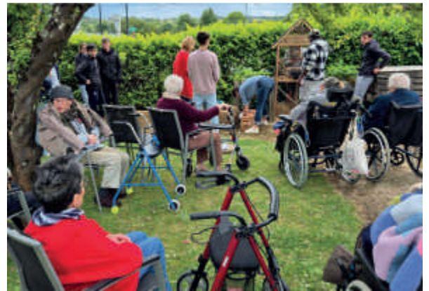
Inauguration de l'hôtel à insectes avec les jeunes de la MFR de Riaillé

De plus, nous avons enfin labellisé notre pôle d'activité et de soins adaptés (PASA) qui permet d'accueillir, 4 jours par semaine, les résidents dans un espace dédié. Cela met en valeur le travail effectué par l'ensemble du personnel. De l'accueil à la restauration, des soins aux animations, de l'entretien à toutes les prises en charges nécessaires. Tout le monde joue le jeu et le résultat est là, on nous aime !