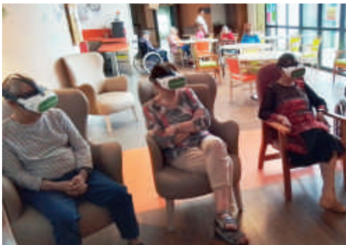
Voyage en réalité virtuelle

Nous souhaitons la rendre accessible de plus en plus : aux personnes non résidentes souhaitant partager un repas, une animation, un moment au pôle d'activité mais aussi aux enfants en continuant notre partenariat avec l'école voisine et nos rencontres inter-générationnelles.