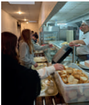
Self : une alimentation saine et équilibrée, et le plaisir du goût partagé

Le nouveau service offre un large choix d'entrées et de desserts pour une éducation au goût et pour faire de la pause méridienne un moment de plaisir. Et, pour la santé des convives et une pratique vertueuse, les produits travaillés (fruits, légumes, viande, œufs, fromages) sont, autant que possible, issus d'exploitations locales.