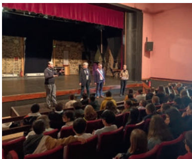
Rallye citoyen le mardi 14 mai