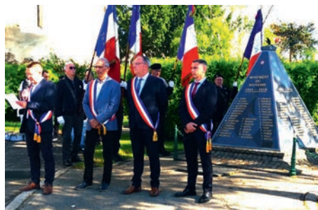
Cérémonie commémorative du 8 mai