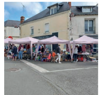
Vide-grenier organisé par l'Amicale laïque Les P'tits Doisneau le dimanche 26 mai