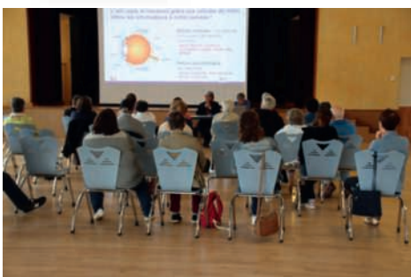
Conférence et ateliers sur la déficience visuelle le vendredi 23 septembre à la Salle de la Riante Vallée