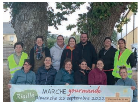
Marche gourmande organisée par l'APEL de l'école Notre-Dame le dimanche 25 septembre : 148 adultes et 26 enfants y ont participé sous un soleil radieux