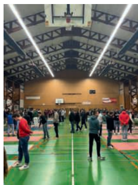
Concours de palets organisé par l'UFCEd le 10 février 2023 au Complexe Sportif de l'Erdre