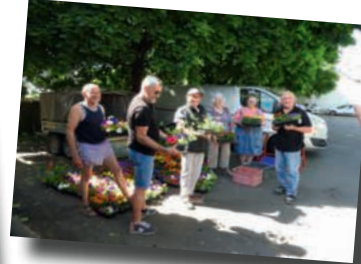
Distribution de plants de fleurs aux habitants dans le cadre de "l'Opération Fleurissement"

Les piques-niques familiaux, les retrouvailles de village, les activités associatives de plein air, les animations de rues reprennent forme. De belles journées animées se profilent à l'horizon.