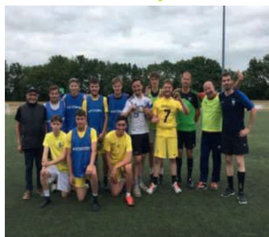
Les deux équipes finalistes du tournoi de football du jeudi 26 mai, organisé par l'UFCEd