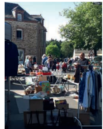
Vide-grenier du dimanche 15 juin, organisé par l'Amicale laïque Les P'tits Doisneau