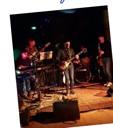
Soirée-concert organisée par l'association Pourquoi Pas le samedi 10 décembre 2022 à la salle de la Riante Vallée