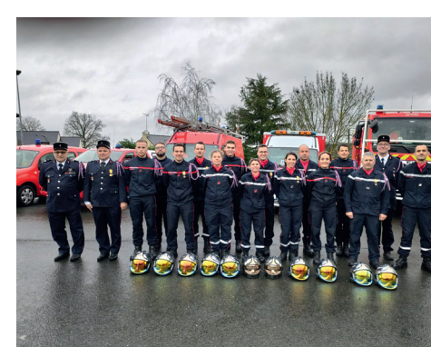
Cérémonie de la Sainte-Barbe du 07 janvier 2023