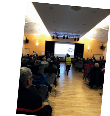
Cérémonie des Vœux de la municipalité du 04 janvier 2023 à la salle de la Riante Vallée