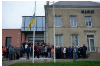
Rassemblement en soutien à l'Ukraine sur le parvis de la Mairie le dimanche 6 mars