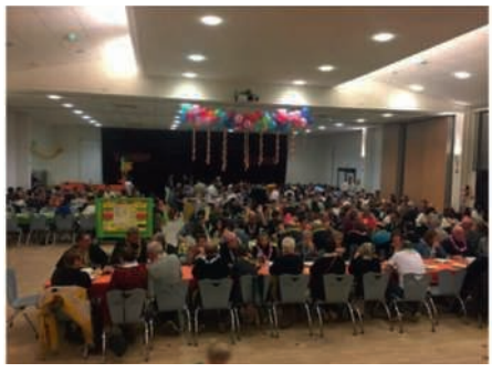
Soirée créole du Club de football UFCED le samedi 05 mars (500 repas vendus)