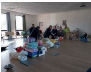
Tri des dons à la Mairie avant regroupement à Ancenis et acheminement en Ukraine

De plus, les foyers pouvant accueillir des ressortissants ukrainiens sont invités à se signaler sur le site parrainage.refugies.info/benevole/