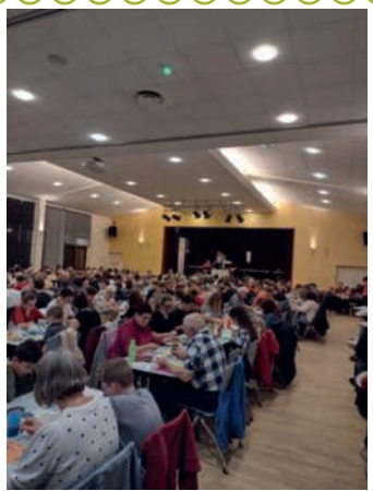
Vif succès pour la soirée LOTO organisée le samedi 12 mars par l'APEL de l'école Notre-Dame